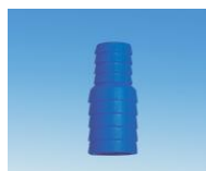
Odvzdušňovací přípojka C1.0605.01