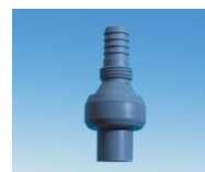
Zpětný ventil s odvzdušněním 3004.53.00