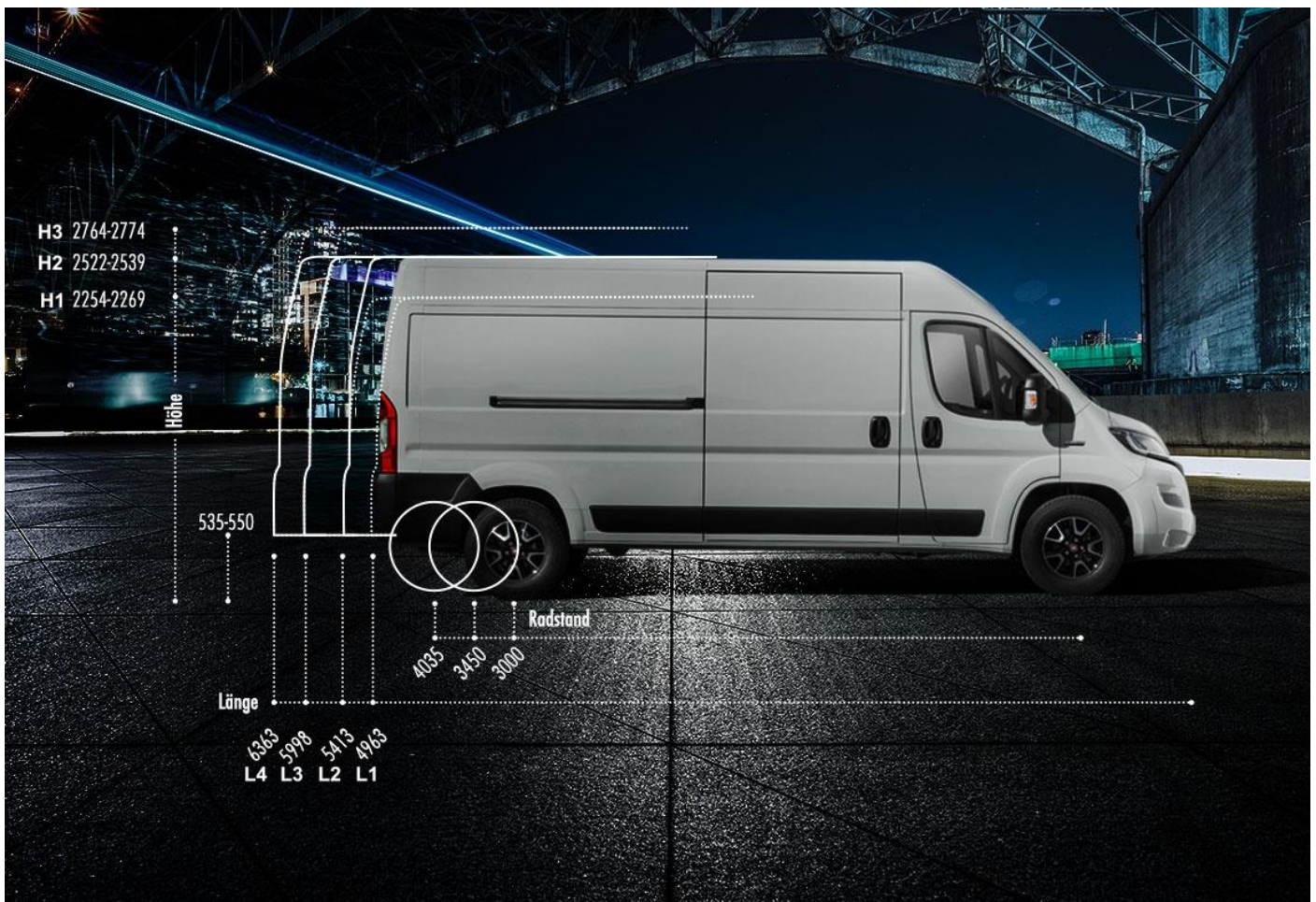
Bildquelle: https://www.fiatprofessional.com/de/ducato-2021/neuer-ducato/versionen Abbildung zeigt Fiat Ducato MY 2022