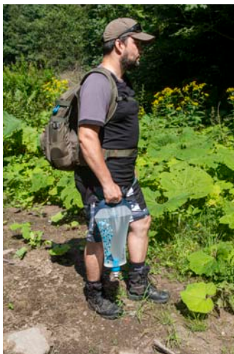
Díky rukojeti přenesete plný filtr od potoku až k tábořišti