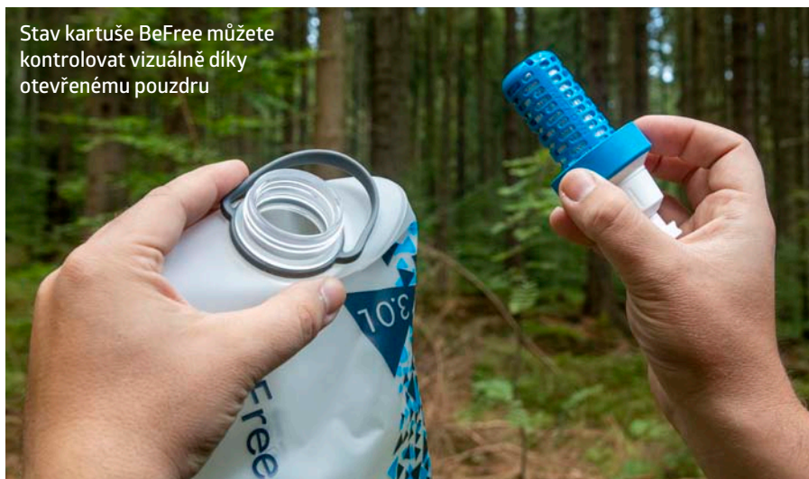
Stav kartuše BeFree můžete kontrolovat vizuálně díky otevřenému pouzdru

Po tomto úkonu jsem veškeré příslušenství sbalil do černé taštičky zavírané zipem a vyrazil do Jeseníků. Instruktoři kurzů přežití upozorňují, že i majitelé kvalitních filtrů by si měli pokud možno vybírat zdroje splňující tři parametry: tekoucí vodu, která je na pohled čirá a také nezapáchá. Na základě této poučky jsem se rozhodl nabrat vodu z Bílé Opavy v lesích nedaleko Vrbna pod Pradědem. Při odšroubovávání kartuše s náustkem jsem nezapomněl na upozornění výrobce, že bych měl sahat jen na objímku, nikoliv na samotné mikrovláknem. Dodám, že při plnění hydrovaku mi pomohlo pryžové madélko za hrdlem, díky němuž mi rezervoár ani s 3 kg tekutiny nevyklouznul z ruky. Pak už stačilo vrá-