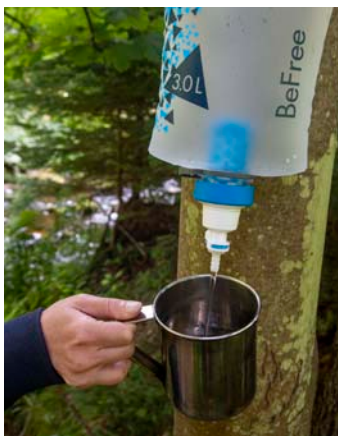
Gravitace protlačí kartuši 3 l vody asi za 9 minut

Při toulání severomoravskými lesy prokázaly oba typy filtrů Katadyn své kvality. Jsou kompaktní, dobře se s nimi pracuje a přefiltrovaná voda chutnala znamenitě. Hiker Pro je výkonnější a díky předfiltru i aktivnímu uhlíku asi též účinnější, nicméně se složitěji udržuje a suší – zbytky vody zůstávají v záhybech a drobných dílech i několik dnů. Osobně preferuji jednoduchost, intuitivnost a co nejskladnější provedení, proto bych si do batohu zabalil BeFree Gravity. Jde však spíše o subjektivní volbu a věřím, že techničtí hráčičkové nebo lidé, kteří se pohybují v místech s méně kvalitními zdroji vody, by sáhli po pumpovacím modelu.