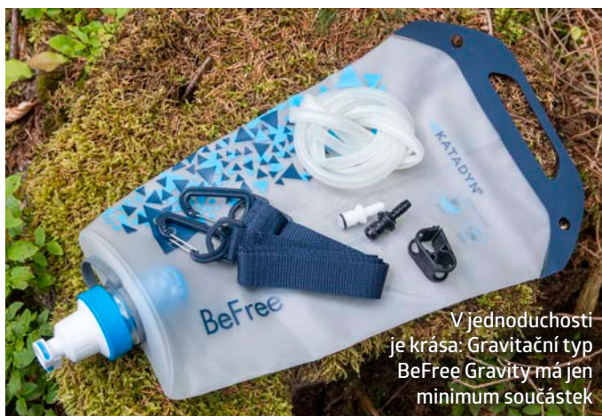
V jednoduchosti je krása: Gravitační typ BeFree Gravity má jen minimum součástek

U EZ-Clean Membrane jde o švýcarské laboratoře Bachema, které filtr prověřily při záchytu bakterie Escherichia coli (původce silných průjmů), Pseudomonas aeruginosa (způsobuje zánět močových cest) nebo enterokoků. Viry, které bývají ještě o řád menší, mikrovláknem už bohužel nezadrží. Máte-li podezření, že se ve zdrojové vodě vyskytují, bude lepší ji po filtraci ještě převařit nebo dočistit Micropurem.