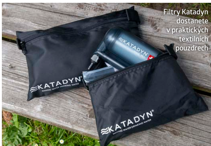
Filtry Katadyn dostanete v praktických textilních pouzdech