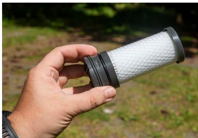
Před dodáním na trh výrobce každou filtrační kartuši testuje a ověřuje její funkčnost

to filtrem zacházet poněkud opatrněji. Na boku pouzdra se nachází jednočinná pumpa – na rozdíl od dvoučinné prohání vodu filtrem jen při pohybu směrem dolů. Ke spodní části systému naváknete rychlospojem vstupní hadičku a na její druhý konec připojíte takzvaný předfiltr. Kromě sacího koše zahrnuje též závaží, můžete jej ponořit do tekoucí i stojaté vody a slouží k zachycení nejhrubších částic nad 130 µm. Podobným způsobem připojíte k horní části kartuše výstupní hadici. Na její opačný konec lze upevnit redukci pro hydratační vak či adaptér pro outdoorové lahve s různým průměrem hrdla (má podobu plastového „špuntu“ s otvorem). Případně hadičku zkrátka strčíte do hrnku či úst.