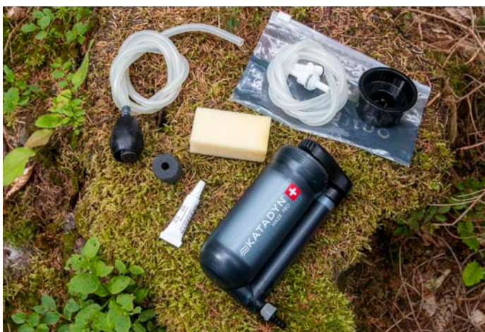
Hiker Pro se dodává se silikonovým lubrikantem na promazání pumpovacího mechanismu