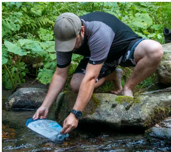
Do vaku z PVC naberete vodu pomocí madélka u hrdla

tit kartuši na své místo a za madlo donést filtr k tábořišti – bez nacvaknuté redukce náustek vodu nepropouští, takže se nemusíte bát, že by cestou vytekla.